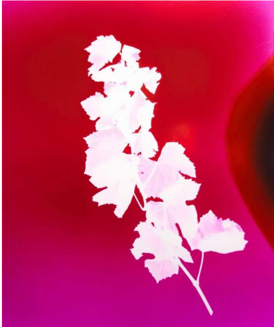
Elsa Leydier Rayogramme sans titre (rameau), série Heatwave , septembre 2019